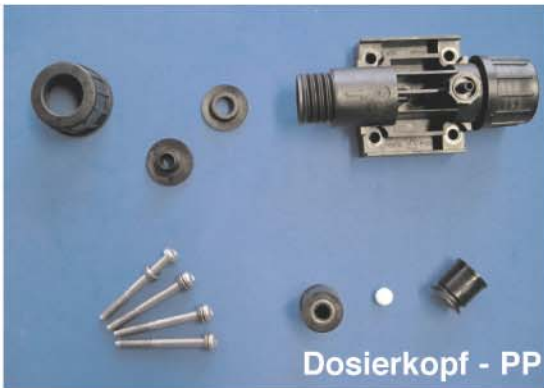
Dosierkopf - PP