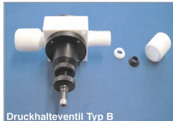
Druckhalteventil Typ B