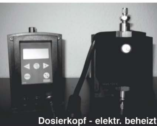
Dosierkopf - elektr. beheizt

Die TELAB Membrandosierpumpe DME vereint alle Merkmale und Funktionen herkömmlicher Dosierpumpen in sich und macht das Dosieren so einfach, dass Sie eine hohe Genauigkeit als Selbstverständlichkeit betrachten können. Die Serie DME deckt einen Leistungsbereich von 0,002 l/h bis 48 l/h bei bis zu 18 bar Gegendruck ab.