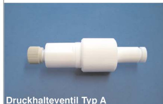
Druckhalteventil Typ A