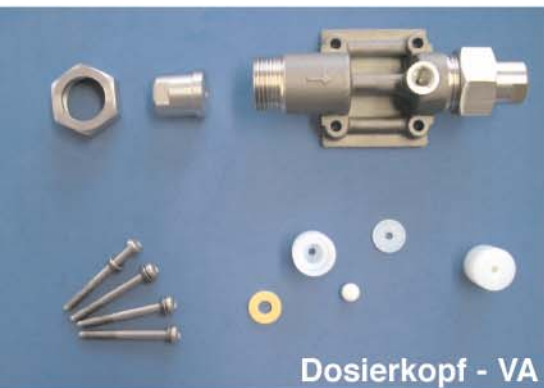
Dosierkopf - VA